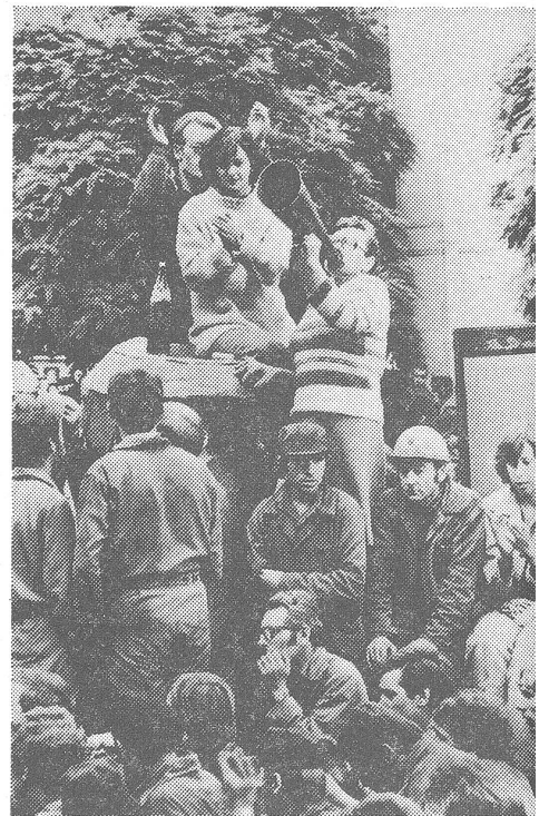
Was die Teilnahme an solchen unerlaubten Manifestationen gemäss Sondergesetz nach sich zieht: Fristlose Entlassung vom Arbeitsplatz oder Ausschluss aus der Hochschule.

2. Die Minister, die Vorsteher von zentralen Ämtern, die Wojwoden und die Präsidenten von Woj-