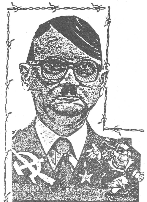
Adolf Jaruzelski. Eine exilpolnische Karikatur.