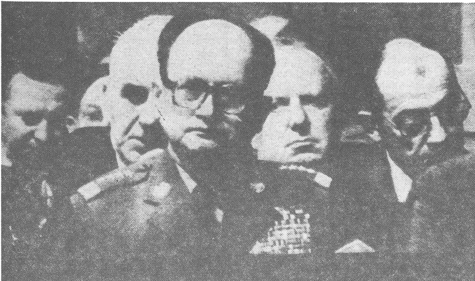
So hatte Jaruzelski am 13. Dezember 1981 am polnischen Fernsehen das Kriegsrecht ausgerufen, übrigens unter Verletzung der polnischen Verfassung. Durch Sondergesetze bleibt Polen im Ausnahmezustand.

Selbstverständlich ist es mein Wunsch, dass der Kriegszustand möglichst bald vollständig aufgehoben werden kann. Aber die erwähnten Gefahren mahnen zur Vorsicht. Sehr viele Menschen fürchten eine vorzeitige Beendigung des Kriegszustandes. Die jetzt erfolgte Suspendierung kann von den parlamentarisch dazu ermächtigten Staatsorganen jederzeit zurückgezogen werden. Ein diesbezüglicher Gesetzentwurf sieht vor, dass der Staatsrat auf Regierungsantrag den Kriegszustand im ganzen Land oder in einem Teil des Landes erneut einführen kann.»