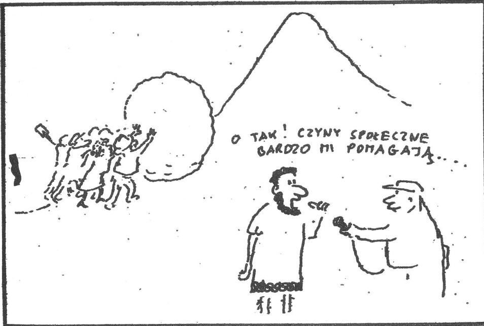
Sisyphus gibt ein Interview: «Ja, die gesellschaftliche Arbeit ist mir sehr bekömmlich.» («Szipilki», Warschau, 21.10.1982)

In Zloty per Kilo kosten (in Klammern Schwarzmarktpreise): Brot 20 bis 40, Schmalz 100 (300), Butter 320 (800), Fleisch 300 (500).