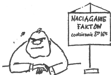
Tatsachenmanipulation täglich zwischen 8.00 und 16.00 Uhr. (Aus der Betriebszeitung «Alchemik», Wloclawek)

Indessen hat die äussere Spannung zwischen Polizei und Bevölkerung so weit nachgelassen, dass die Polizisten ihren Dienst wieder einzeln versehen können.