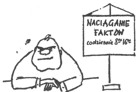
Tatsachenmanipulation täglich zwischen 8.00 und 16.00 Uhr. (Aus der Betriebszeitung «Alchemik», Wloclawek)

Indessen hat die äussere Spannung zwischen Polizei und Bevölkerung so weit nachgelassen, dass die Polizisten ihren Dienst wieder einzeln versehen können.