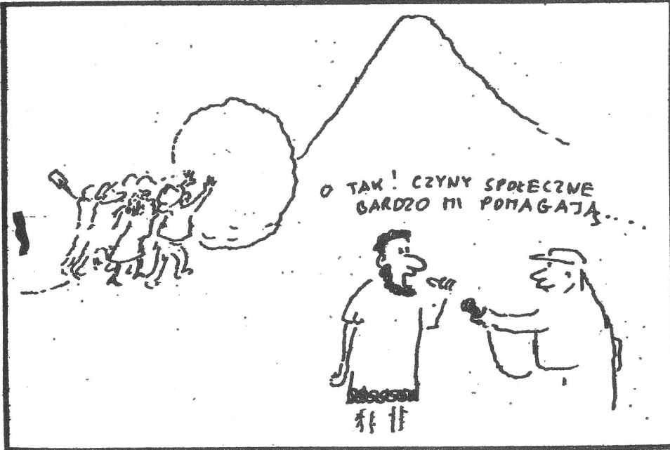
Sisyphus gibt ein Interview: «Ja, die gesellschaftliche Arbeit ist mir sehr bekömmlich.» («Szipilki», Warschau, 21.10.1982)

In Zloty per Kilo kosten (in Klammern Schwarzmarktpreise): Brot 20 bis 40, Schmalz 100 (300), Butter 320 (800), Fleisch 300 (500).