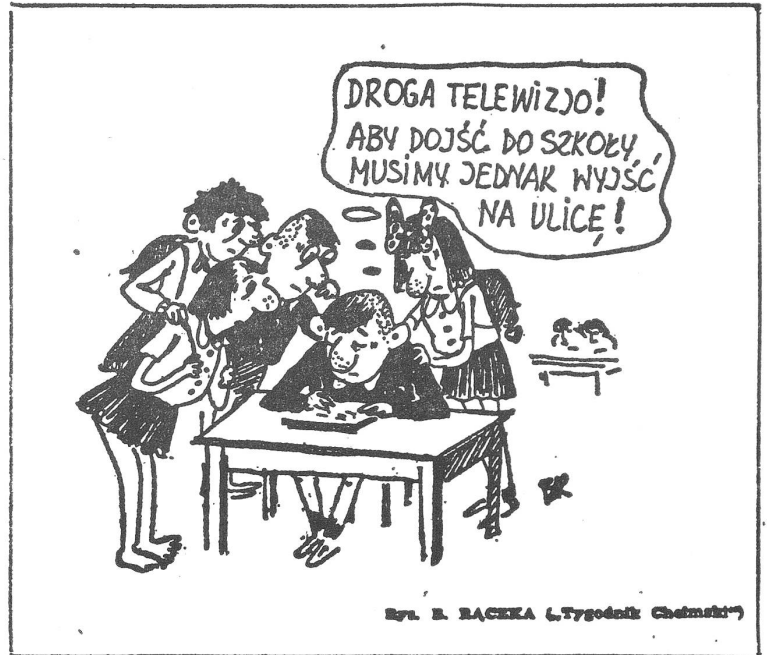
Ryl. R. RACEKA („Tygodnik Chłopski“)