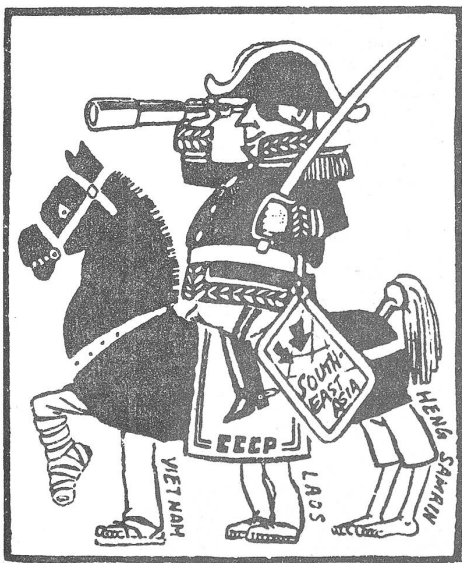
Die Sowjetunion reitet auf ihren Stellvertretern. «Das Pferd heisst Hegemonismus.» («Beijing Rundschau», 24.4.1982)

Die Änderung im sino-sowjetischen Verhältnis ist weniger spektakulär, als viele westlichen Deuter und Propheten wahrhaben wollen. Immerhin: Für die Sowjetunion ist «Ruhe an der chinesischen Front» wichtig genug. So kann sie sich um so besser auf ihre anderweitigen Unterwerfungsaufgaben konzentrieren.