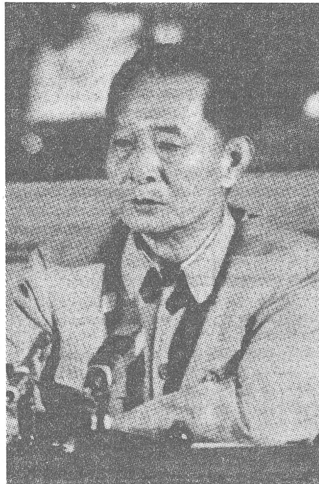
Parteichef Hu Yaobang: China hängt sich nicht an.

China hatte mit den nichtkommunistischen Industrieländern eine Koalition gegen die sowjetische Expansion bilden wollen, ist aber von seinen