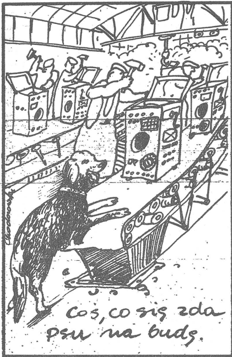
«Cos, co siş zda psu na budş.»

«Wird das wenigstens brauchbar für eine Hundehütte?» («Szpilki», Warschau, 7. 10. 1982)