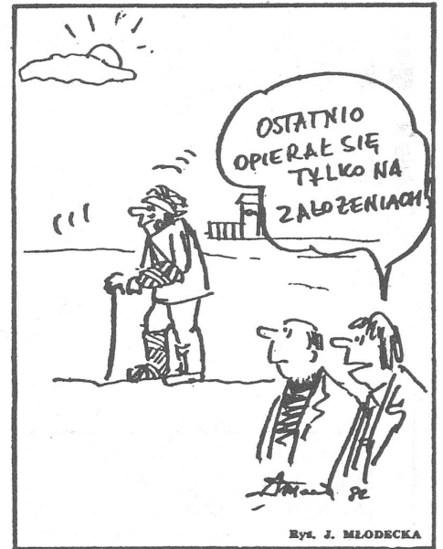
Er hat sich auf die Hypothesen gestützt. («Szpilki», Warschau, 7.10.1982)