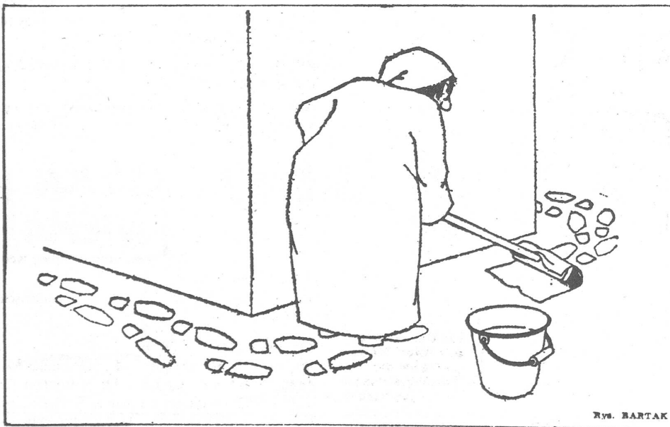
Der Spurenverwischer mit Lebensaufgabe. («Polityka», Warschau, 9.10.1982)

RS: Die verantwortlichen Offiziere wurden sowjetischerseits bestätigt. In den Mannschaften waren die Soldaten von den Unteroffizieren überprüft worden, und sämtliche Informationen standen uns zur Verfügung. Für die «Säuberungs-