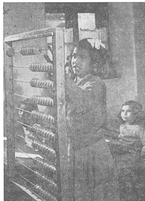
Zigeunermädchen in einer ungarischen Dorfschule. Die früheren speziellen Zigeunerschulen hat man aufgehoben und lässt die Zigeunerkinder am allgemeinen Unterricht teilnehmen. Häufig sind sie wegen Sitzenbleiben älter als ihre Klassenkameraden.

(Atlanta in der Slowakei. Wobei es gutgemeint, aber wenig behelflich ist, wenn die Presse darauf aufmerksam macht, dass es «auch fleissige und ehrliche Zigeuner» gibt. Das ist so wie mit der früheren – und vielleicht schon bald wieder aktuellen – Versicherung «Es gibt auch anständige Juden», die das Gegenteil als Regel voraussetzt.)