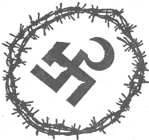
Nazisowjets. («Sprzeciwi», Göteborg, Nr. 4/1982)