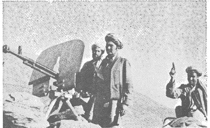
Schlecht bewaffnet, international im Stich gelassen und doch erfolgreich: die Mujahedin.

massive Truppeneinsatz und die Zerstörungen haben die Bevölkerung dem Regime von Babrak Karmal noch mehr entfremdet. Viele Afghanen, die sich zuvor der Neutralität befleißigten, helfen jetzt den Widerstandskämpfern. Sogar führende Mitglieder der prosovjetschen «Demokratischen Volkspartei» äussern wachsende Besorgnis wegen der sowjetischen Exzesse. Grosse Operationen wie die im Pandschir-Tal,