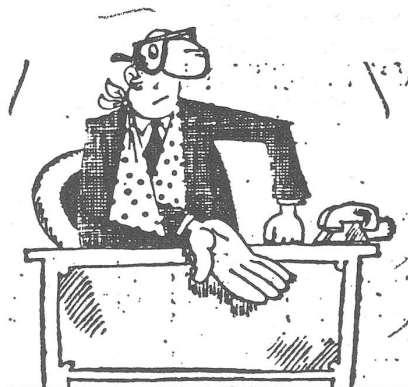
Ohne Worte. («Trud», Moskau, 29.7.1982)

Aber wie immer: In der Sowjetunion ist Diebstahlbekämpfung erwünscht. Nur sollte jeder Diebstahlbekämpfer merken, wie weit er gehen kann...