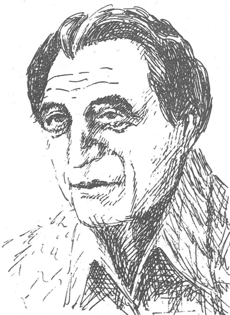
Sinan Chasani, der Parteichef von Kosovo.

Und nun zur Schilderung der Ereignisse durch die Dorfbewohner. (Laut späterer Präzisierung haben sechzig von ihnen diesbezügliche Aussagen gemacht; bei einer Gesamtzahl von achtzig Haushaltungen scheint das repräsentativ genug.)