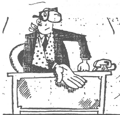
Ohne Worte. («Trud», Moskau, 29.7.1982)

Aber wie immer: In der Sowjetunion ist Diebstahlbekämpfung erwünscht. Nur sollte jeder Diebstahlbekämpfer merken, wie weit er gehen kann...