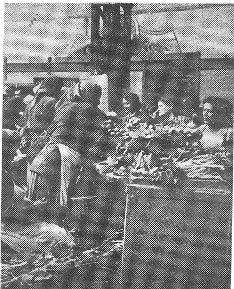
Kolchosmarkt in Kiew.

vermehrte, dann wollen sie ihn mir sicher später wieder wegnehmen.