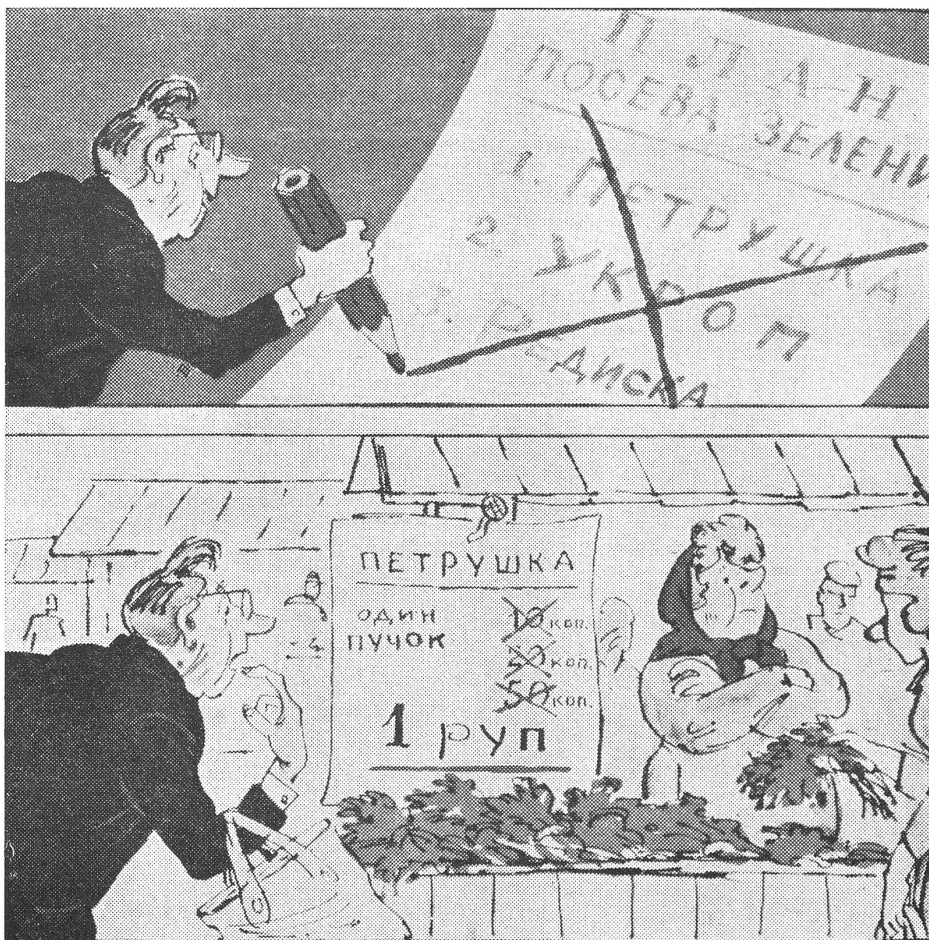
Auf dem (freien) Kolchosmarkt zeigt sich, was die Bürokratie verplant hat. Oben: Der zuständige Funktioniär streicht den Plan für die Aussaat von Petersilie, Dill und Radieschen. Unten: Und dann ist er bass erstaunt, auf dem Kolchosmarkt feststellen zu müssen, dass der Preis für ein Bündel Petersilie auf 1 Rubel geklettert ist. (1981 betrug der monatliche Durchschnittslohn für Arbeiter und Angestellte offiziell 172 Rubel.) Eine Karikatur von «Krokodil», Moskau.

Der Bauer soll weiterhin, und möglichst immer mehr, als Privatproduzent der sozialistischen Gesellschaft nützlich sein. In seiner Freizeit.