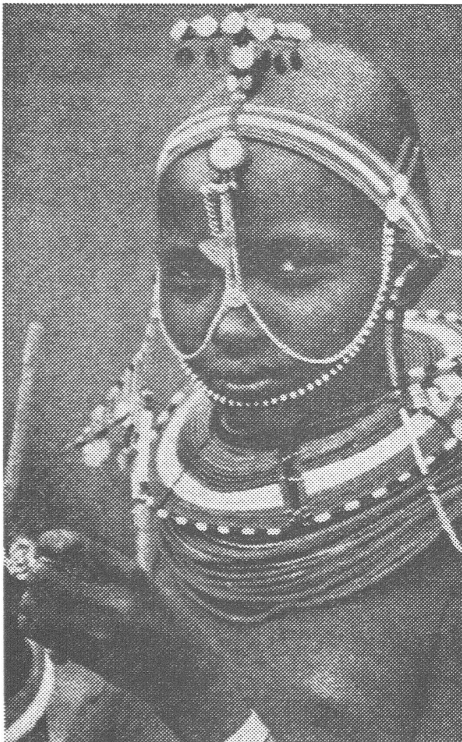
Massai-Frau in Tansania. Demokratisch über die Weltwirtschaftsordnung befinden, wenn man nicht einmal die Ordnung im eigenen Land bestimmen darf?

Die Autoren betrachten nämlich die Arusha-Initiative selber keineswegs als Diskussionsobjekt