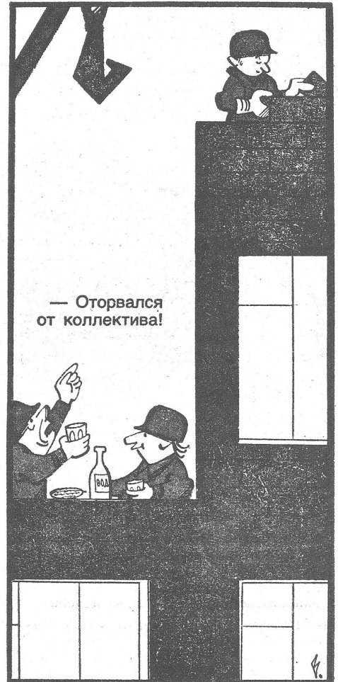
«Der dort oben hat sich vom Kollektiv entfernt!» («Krokodil», Moskau, Nr. 11/1982; ebenso die folgenden Karikaturen.)

Dieser Mann namens Kusun lernt in den Stunden, da er auf eine Audienz beim künftigen Chef warten muss, die Ursachen schwacher Produktivität schon grossenteils kennen und konfrontiert alsbald den Boss damit. Speichel-