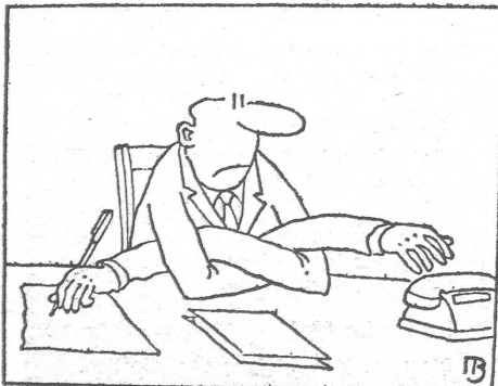
«Literaturnaja gaset», Moskau, 10. 3. 1982.

Man sieht es dem Mann nach, dass er in seinem persönlichen Leid das Mass verliert während der Trauerfeier... nämlich das Mass des beschäftigten Herumlungerns, bei dem die jünge-