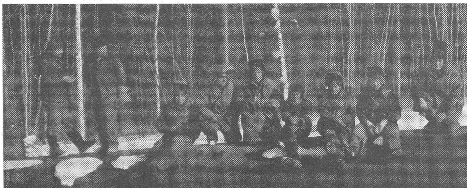
Eine Brigade von Rohrschweisern in Sibirien.

Wir können dies erklären, zu entschuldigen vermögen wir es nicht. Denn darauf, dass die Sowjetunion einen aktiven Beitrag zur Welternährung erbringt, ist die ganze Welt zunehmend angewiesen. Heute würden vermutlich zwei amerikanische Missernten genügen, um eine Hungerkatastrophe von ungeahntem Ausmass herbeizuführen. Die Welternährung ist auf den nord- und südamerikanischen Trägern allein zu schwach abgestützt.