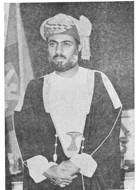
Sultan Qabus Ibn Said von Oman: Höfliche Mahnung an den Westen, für seine Freunde unter den Entwicklungsländern auch etwas zu tun.