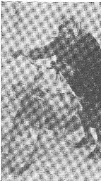
Bäuerin bringt Roggen in die Stadt. Ein wirkliches Bild aus der Kriegszeit von heute. («Express Wieczorny», Warschau, 3. 3. 1982)

710 Angestellte und Mitarbeiter des Warschauer Gesundheitsdienstes haben eine Bittschrift an Jaruzelski gerichtet. Im Schreiben heisst es: «In Lagern und Gefängnissen hält man schwangere Frauen, Mütter von kleinen Kindern, alte und kranke Personen in unmenschlichen Bedingungen. Selbst die minimale medizinische Betreuung wird ihnen vorenthalten.» Und in einer andern Stelle: «Der psychologische Druck des Terrors wirkt sich auf die hungernde Bevölkerung verheerend aus. Die Zahl von Fehlgeburten, Frühgeburten, Selbstmorden und Herzinfarkten hat sprunghaft zugenommen.» Der Brief schliesst mit der Bitte