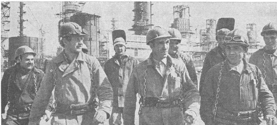
Will man die Ketten der Arbeiter lockern? Montagetrupp in Ufa.