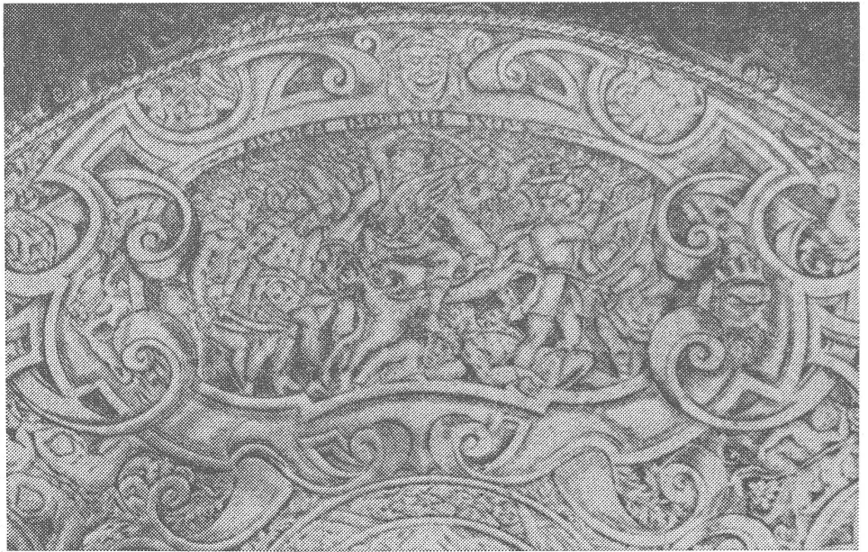
Kosovo ist mit Erinnerungen an historische Auseinandersetzungen belastet. Dieser Renaissance-Teller (Ausschnitt) aus dem Jahre 1562 stellt die Schlacht auf dem Amselfeld (Kosovo Polje) von 1389 dar, bei welcher die Serben von den Türken besiegt wurden.

Angesichts der zentrifugalen Kräfte herrscht in der Parteiführung das Bedürfnis vor, eine Autorität zu beweisen, die sie moralisch nicht hat. Zur Diskussion steht eine Rückkehr zum «demokratischen Zentralismus», das heisst zur hierarchischen Parteidisziplin nach sowjetischem Vorbild. Solche Bestrebungen werden in der Ostblockpresse sachlich bis vorsichtig lobend registriert, obwohl eine interne Annäherung an das sozialistische Modell des Sowjetlagers noch kein Beweis für äusseren Anschluss wäre. Indessen ist Jugoslawien auch sonst im Visier.