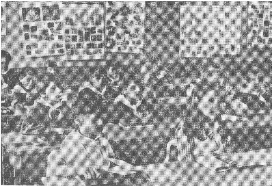
In den jugoslawischen Schulen wird je nach Region in insgesamt zehn Sprachen unterrichtet: Serbisch, Kroatisch, Slowenisch, Mazedonisch, Ungarisch, Albanisch, Slowakisch, Rumänisch, Türkisch und Italienisch. Aber mit der sprachlichen Berücksichtigung der Probleme eines Vielvölkerstaates ist es noch lange nicht getan.

Zur Hinterlassenschaft von Konflikt und Konfliktbewältigung gehört heute ein gründlich gestörtes Verhältnis zwischen den Albanern und den Nichtalbanern. Insbesondere sind viele provinziensässige Serben, die nichts dafür können, summarisch verhasste Opfer des albanischen