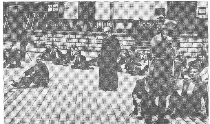
Kriegsrecht der Nazis und Zerstörung Warschaus 1944. Waren die Opfer schuld, weil sie die Staatsraison missachteten?