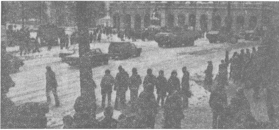
Kriegszustand in Polen: «Die erträglichste aller Varianten.»

Denn man muss klar sehen, wohin man kommt, wann man die totalitäre Staatsraison als gültigen Sachzwang anerkennt. Das Vorgehen des Nazi-regimes gegen das gleiche Polen, gegen die Juden und die übrige ergreifbare Umwelt: das war auch (hier ist das Wort am Platz) Staatsraison jener Art.