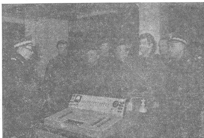
Mitglieder des Militärates besuchen eine Militäreinheit. Das Bild erschien am 2./3. Januar in «Zolnierz Wolnosci», dem Organ der politischen Hauptverwaltung der Armee.