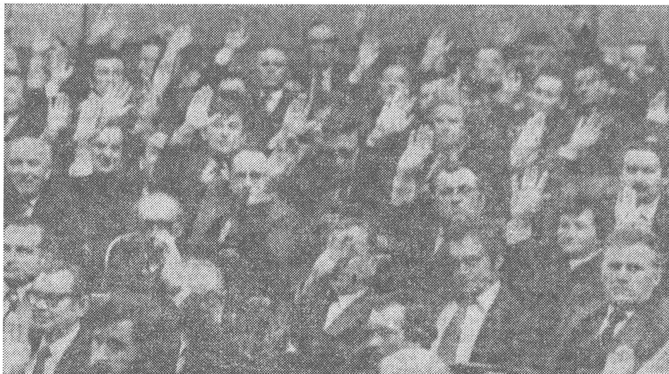
Nach sechs Wochen, am 25. Januar 1982, stimmte das Parlament rückwirkend der Ausrufung des Kriegsrechts zu. Die Abstimmung im Sejm. «Trybuna Ludu», Warschau, 27. 1. 1982.

Die Internierung erfolgt auf Befehl des Kommandanten der Wojewodschaftspolizei. Die Anrufung eines Gerichtes ist nicht möglich. Rekurse sind dem Innenministerium vorzulegen, im Falle von Ausländern einer eigens dazu geschaffenen Internierungskommission. («Kurier Polski», 11.1.1982, und «Dziennik Polski», Nr. 29/1981, Posten 168)