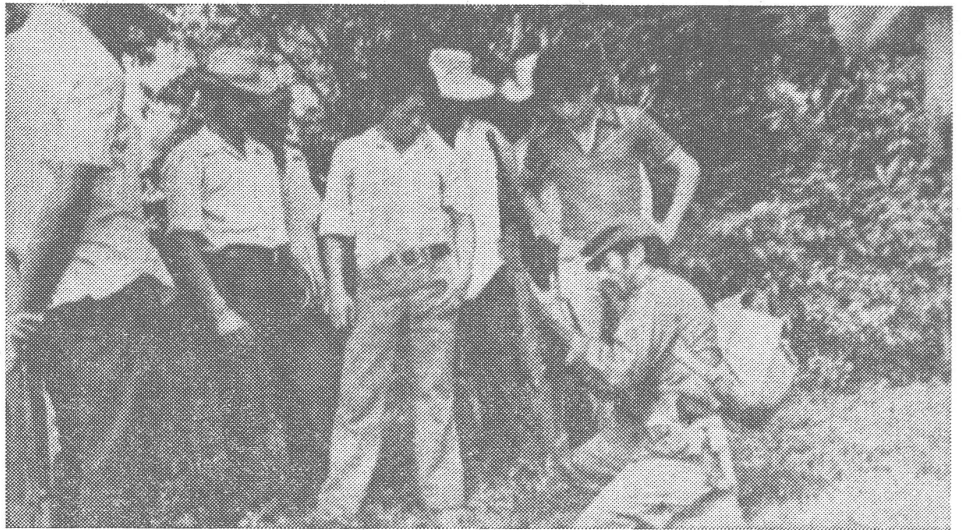
Im benachbarten Salvador: Angehörige der aufständischen Streitkräfte «Farabundo Marti» werden «von einem Ausbildner in der Handhabung einer modernen Infanteriewaffe unterwiesen» («horizont», Ostberlin). Woher kommen die Ausbildner und die modernen Waffen?

Bis anhin war die Sowjetunion der hauptsächlichste Waffenlieferant, einschliesslich T-55-Panzer. Neuerdings darf das Regime auch Waffen aus Frankreich erhoffen. Nicaraguanische