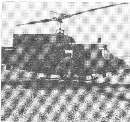
Armeehelikopter an der Strasse von Ormuz.

Omans Grenze zu Südjemen, dem immer stärker sowjetisch satellisierten Nachbarstaat, ist schwer bewacht. Südjemen hält noch immer Gebiete des nationalen Territoriums von Oman besetzt. Diese Lage rührt vom seinerzeitigen Aufstand in