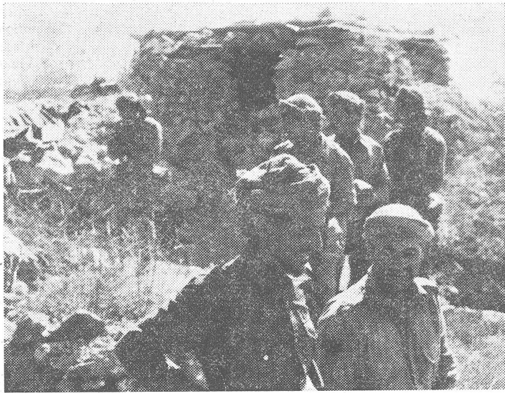
Grenztruppen in der Provinz Dhofar. Im Vordergrund rechts ein Unteroffizier der regulären Streitkräfte, links ein interessanter Besucher. Er gehört zu einer eigenständigen Beduinentruppe, sozusagen einer Stammesmiliz. Der gleiche Mann ist auf S. 1 auch als Titelbild zu sehen.

Detail dürfte in Europa selbst kaum so wichtig genommen worden sein.