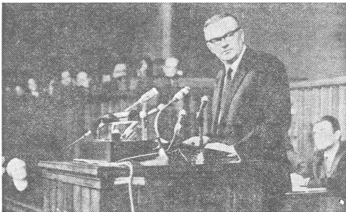
Der ehemalige Ministerpräsident Jaroszewicz «unterschrieb sklavisch» alle Verträge für Lieferungen an die Sowjetunion. Für Polen waren sie reine Verlustgeschäfte.

schwarzen Markt zahlt man für einen Dollar 800 Zloty.) So eine Rubelparität hat nur einen internen Propagandawert. Und zu gebrauchen ist sie höchstens für Leute im diplomatischen Dienst.