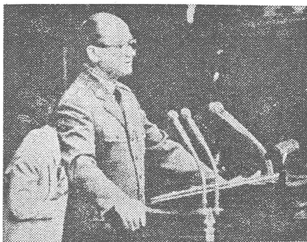
Jaruzelski am Mikrophon.

sein; er hätte unserer Gewerkschaftsbewegung Widerhall im ganzen sozialistischen Lager gegeben. Das war der Alptraum der Breschnews und Suslows.