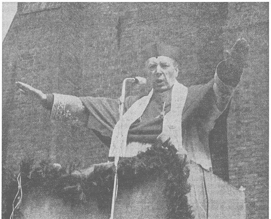
Kardinal Wyszyński (Bild aus den sechziger Jahren): Er fürchtete sich nicht vor Verhandlungen und verhandelte nicht aus Furcht.

Noch 1966 hatte die Regierung zweimal einen Polen-Besuch von Papst Paul VI. ablehnen kön-