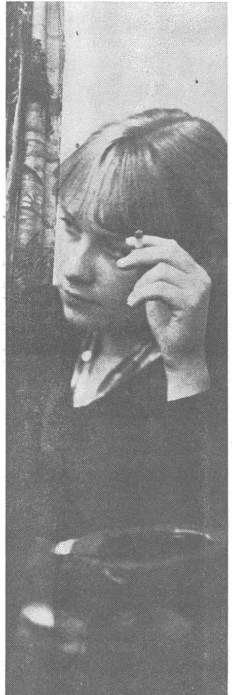
Polnische Studentin. Bild aus der Zeitschrift «Polen», Warschau (Nr. 3/1981). Der Textbeitrag dazu über die polnische Hochschuljugend trägt den Titel «Apathie oder Engagement?».