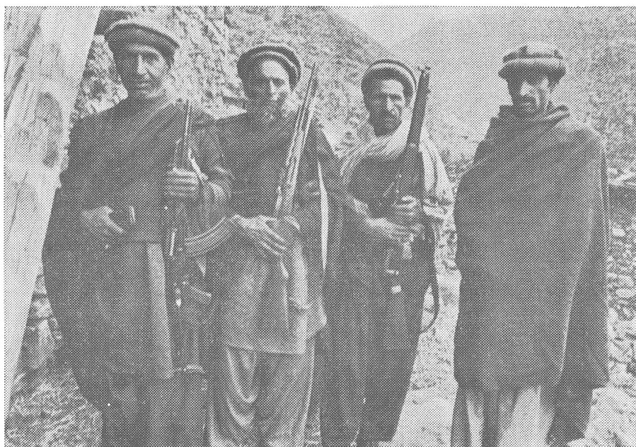
Partisanen in Afghanistan.

Das zweite Jahr, in welchem die sowjetische Armee in Afghanistan im Kriegseinsatz steht, hat zu keinen militärischen Entscheidungen geführt. Bloss zum Tod von Tausenden von Afghanen, von Männern, Frauen und Kindern. Zur Flucht und Vertreibung von Hunderttausenden. Und zur Hinnahme durch die Welt.