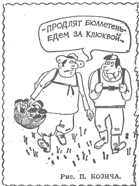
Рис. П. КОЗИЧА.