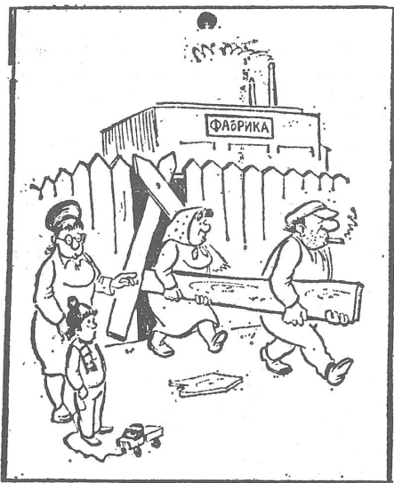
Diebstahl am sozialistischen Eigentum (plus unbeabsichtigtes Streiflicht auf die Stellung der Frau): «Guck mal, Bub, wie lieb der Onkel da der Tante hilft im Haushalt.» (1. 10. 1981)

der Konsumorganisation hielt seine Teilnahme nicht für erforderlich; angeblich hatte er sich in der Zeit geirrt.» Und bei einer andern Gelegenheit: «Leider hielt es von der Betriebsleitung niemand für nötig, dem Betriebskollektiv zu begegnen.» Oder: «Die Leute hofften auf Antwort vom Vorsitzenden des Stadtsowjets. Man hatte ihn rechtzeitig eingeladen, aber es war ihm unmöglich, auch nur eine halbe Stunde zu erübrigen, um sich mit den Werkträgern zu treffen.»