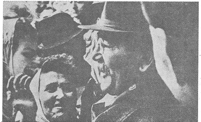
Imre Nagy, der legale Ministerpräsident der neuen Regierung von 1956.

Die ungarische Neutralitätserklärung war eine Konsequenz der sowjetischen Aggression und nicht deren Ursache. Was aber bezweckte die ungarische Regierung mit ihrem Schritt? Sie hoffte vor allem auf eine Aktivierung der Vereinten Nationen. Der Angriff auf ein neutrales Land würde, so hoffte man in Budapest, als flagrante Verletzung des Völkerrechts zum Anlass für eine internationale politische Aktion gegen das sowjetische Vorgehen werden. Die Hoffnung war falsch. Die Geschichte wird das Datum des 1. November 1956 als den Beginn der politischen Impotenz der UNO registrieren. ■