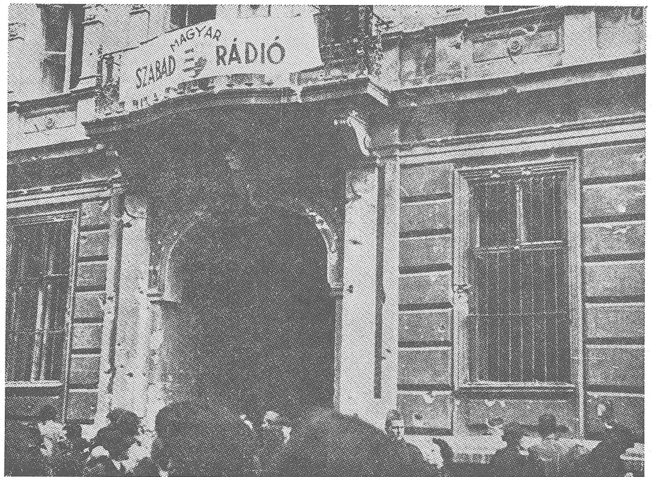
Hier vor Radio Kossuth wurde aus der Reformbewegung die Revolution, als die Leute des Sicherheitsdienstes AVO aus den Fenstern in die Masse friedlicher Demonstranten hineingeschossen.