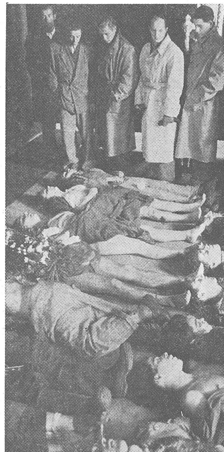
Die heutige Geschichtskunde über 1956 streitet die Schuld der früheren Machthaber nicht ab, relativiert sie aber zu Deformationen wie Korruption, Unfähigkeit und Willkür. Ueber den mörderischen Charakter des Machtapparates geht man hinweg. Am 27. Oktober 1956 massakrierte der Sicherheitsdienst in Magyarovar 82 friedliche Demonstranten, grossteils Jugendliche.

Wie gesagt, findet in Ungarn die Behandlung der Revolution von 1956 im Rahmen eines allgemeinen Versuchs statt, wieder zu einem Gesichtsbild zu kommen, möglichst zu einem sozialistischen.