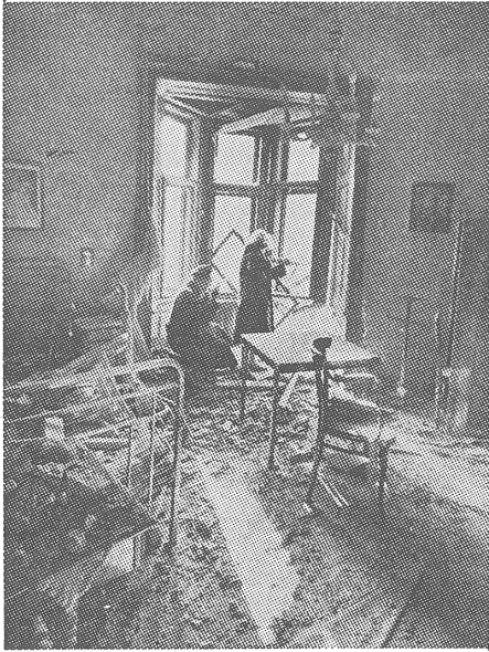
Innenaufnahme der Revolution.

Die Sowjetunion führte gegen den neuen sozialistischen und demokratischen Staat Ungarn einen nicht erklärten Krieg und gewann ihn mit ihrer Uebermacht. Das ist der schlichte Tatbestand.