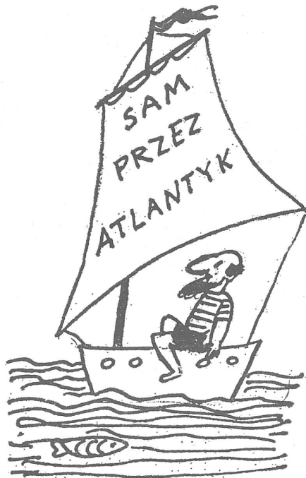
Allein über den Atlantik. («Kurier Polski», Warschau, 18.-20. 9. 1981)

Die Sowjetunion ihrerseits hat sich mit der Existenz des freien Gewerkschaftsverbandes in Polen nicht abgefunden. Laut sowjetischer Diktion ist die Solidarnosc ein «trojanisches Pferd der Konterrevolution innerhalb des Sozialismus». Was Revolution wäre und was Konterrevolution, ist eine Definitionsfrage, aber sonst braucht man der sowjetischen Diagnose nicht zu widerspre-