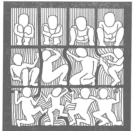
Die Titelillustration der Broschüre.

Das Ornat hat seine Stickereien, und manches im Text ist belletristisch betrachtet interessant. Für einen Skeptiker wie den Rezensenten, der weder