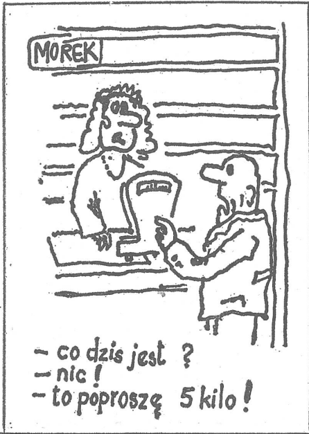
— «Was gibt es?» — «Nichts!» — «Davon 5 Kilo.» («Głos Wyrzeza», Gdansk, 27. 9. 1981)