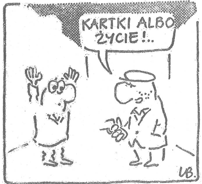
Oben: «Lebensmittelkarten oder Leben!» («Tygodnik Powszechny», Krakau, 6. 9. 1981)