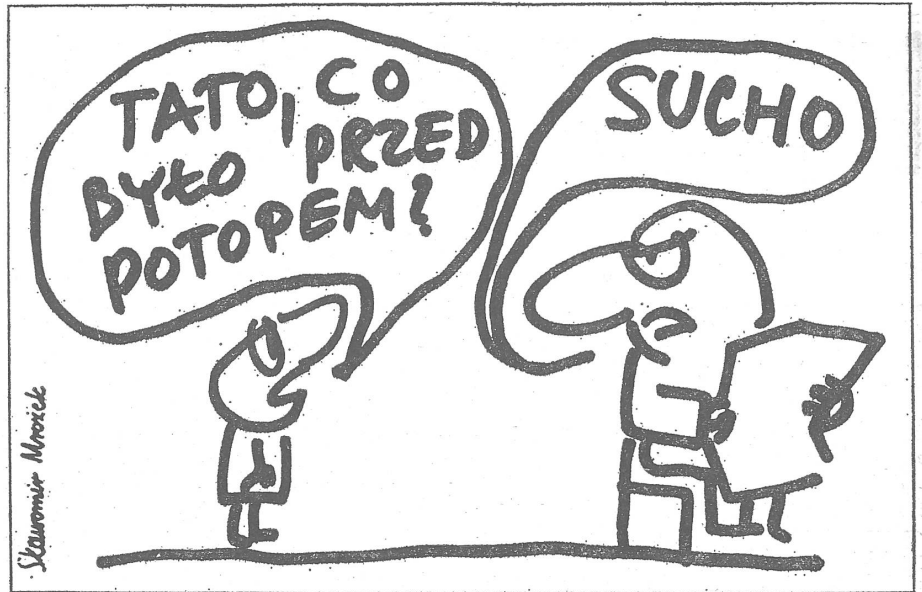
«Du, Papi, was war vor der Sintflut?» — «Trockenheit.» («Szpilki», Warschau, 28. 8. 1981)