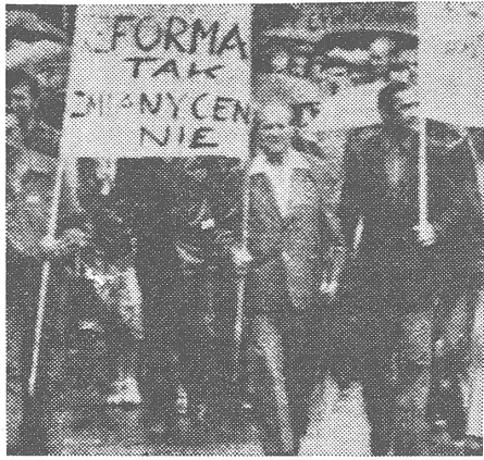
Demonstration in Polen: «Reformen ja, Preissteigerungen nein.»