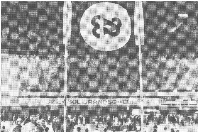
Der Kongress von Solidarnosc: Internationalistische Solidarität mit den werktätigen Massen, ergo anti-sozialistisch und konterrevolutionär.

Die Partei stellt auch den «totalen Zusammenbruch der Wirtschaft» und «die Schliessung der Betriebe» in Aussicht. Damit hofft sie, die aufreißerischen und «konterrevolutionären» Arbeiter zum Gehorsam zu zwingen. Motto: «Je schlechter für das Volk, desto besser für den Sozialismus.» Der Hunger ist eine brauchbare Waffe, und man kann erst noch dem Gegenspieler die Schuld dafür zuschieben. Und wie gesagt, gibt es zu diesem Vorgehen einen marxistischen Erfahrungsschatz.