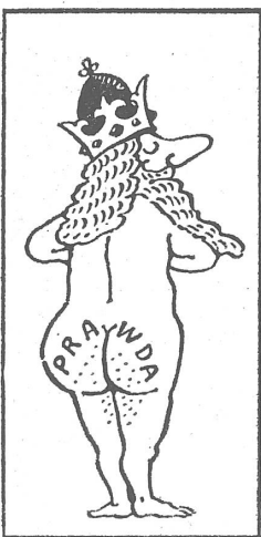
Prawda (Wahrheit): Der nackte König und die nackte Wahrheit. («Szpilki», Warschau, 6. 9. 1981)

Für die Franzosen sind Seitensprünge eine natürliche Sache. Als ihnen die Eitelkeit eines Giscard und die apodiktischen Vorträge eines Barre doch zu langweilig wurden, wählten sie Mitterrand. «Keine Angst», hat mir ein Pole gesagt, «der ist genau so sozialistisch wie du und ich.» Demgegenüber haben die Franzosen den Wechsel nicht so leichtfertig aufgenommen. Die Staatsbeamten, Polizisten und Fernsehleute haben sofort auf die Ideen der neuen Herren umgeschaltet.