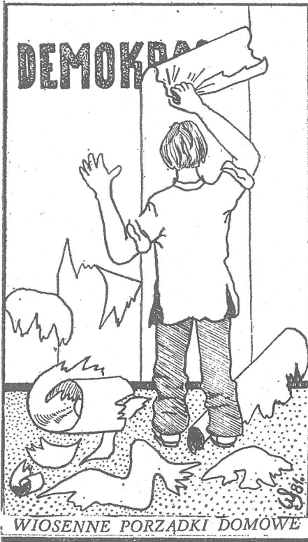
Die lange überklebte Demokratie wird freigemacht: «Frühlingsputzete». (21. 6. 1981)