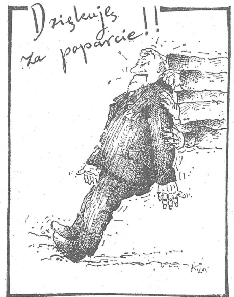
Der Widerstrebende im Erneuerungsprozess: «Danke für die Unterstützung!» (21. 6. 1981)

Die Wegleitung zum Millionengeschäft ist in der populären Warschauer Zeitung «Express Wie- czorny» aufgeführt als Vorspann zu einem Be- richt über die Preisreform. Diese ist — wie man am Beispiel sieht — unerlässlich. Aber gleich- zeitig ist sie auch heikel. Die Versuche zu Preis- erhöhungen hatten zu den Unruhen von 1970, 1976 und 1980 geführt. Deshalb wissen die pol- nischen Volkswirtschaftler zwar, was nötig wäre, aber sie wissen nicht, was politisch möglich ist. ■