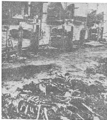
Den totalitären Massenmord (Verbrennungsstätte im KZ Majdanek) zum Ausländerproblem verniedlichen?

Doch zurück zur BRD. Dort haben dank dieser grosszügigen Asylpolitik mittlerweile Zehntausende von angeblich politisch verfolgten Palästinensern Zuflucht und Lebensunterhalt auf deutsche Staatskosten gefunden. Offenbar wagt nie-