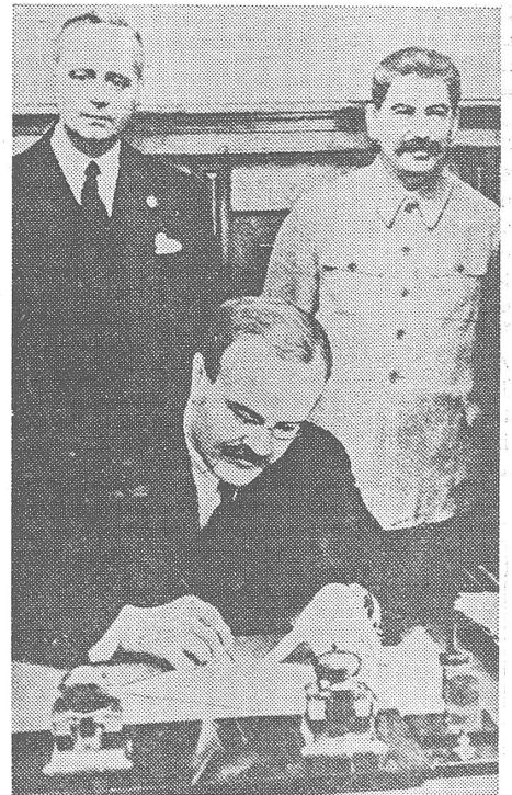
Der Pakt von 1939 (Molotov unterschreibt; dahinter Stalin und Ribbentrop): auf Misstrauen gegründet.

Paul Schmidt, Chefdolmetscher (für Französisch und Englisch) und Leiter des Ribbentropschen Ministerbüros, hat bereits 1949 ein fast 600 Seiten umfassendes Erinnerungsbuch «Statist auf diplomatischer Bühne» herausgebracht. Während er aber alle Staatsbesuche peinlich genau registriert und die Gespräche mit den Staats-