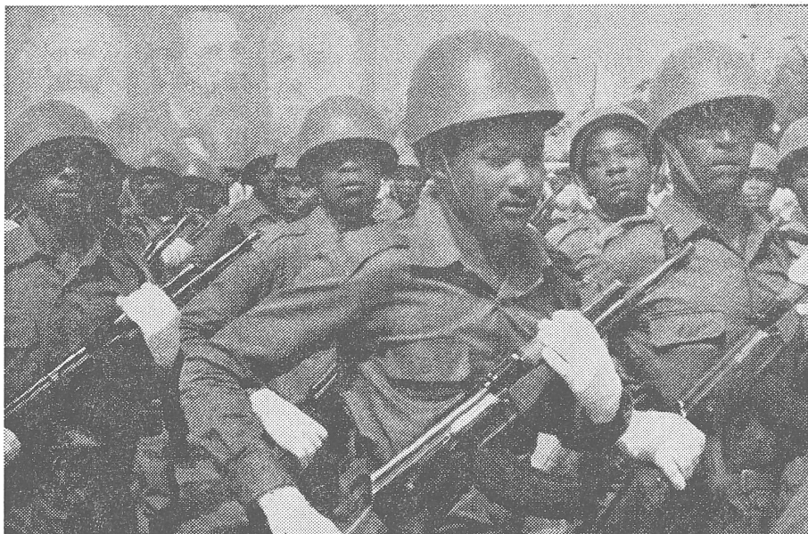
... später eine wohldressierte Armee zu machen, wie sie die sowjetisch oberkommandierten und kubanisch umrahmten MPLA-Verbände in Angola darstellen, die man gegen Partisanen und Bevölkerung einsetzt.

Aber auch sonst. Südafrika ist strategisch überaus wichtig, und ein wichtiger Punkt betrifft die Sowjetunion, welche die Unabhängigkeit der Länder in dieser Region bedroht; sie hat ja genügend andere Länder des Kontinents in ihre neokoloniale Abhängigkeit gebracht.