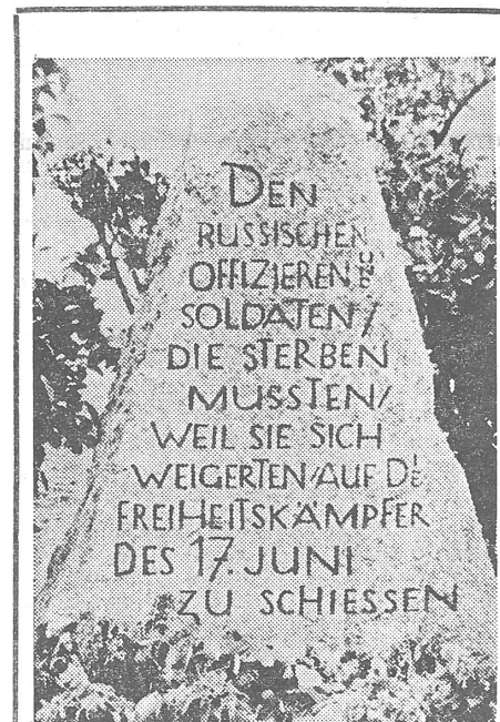
Gedenkstein in der Potsdamer Chaussee

Für die freiwillige vormilitärische Ausbildung der nichtstudierenden Jugend sorgt die grösste paramilitärische Organisation der Welt, die DOSAAF (Freiwillige Unionsgesellschaft zur Förderung der Land-, Luft- und Seestreitkräfte), welche in jeder territorialen Verwaltungseinheit des Staates Militärklubs und einen grossen Apparat aus Berufssoldaten hat. Sie organisiert — unter Mitwirkung der Jugendorganisation Komsomol — auch den Militärsport, die jährlichen Wettkämpfe in Wehrsportdisziplinen sowie die Wehrsportwettkämpfe (Olympiade). Die Grundlage für diese Wettkämpfe bildet das GTO-System (Bereit zur Arbeit und Verteidigung), das für alle Disziplinen und Altersgruppen Lei-