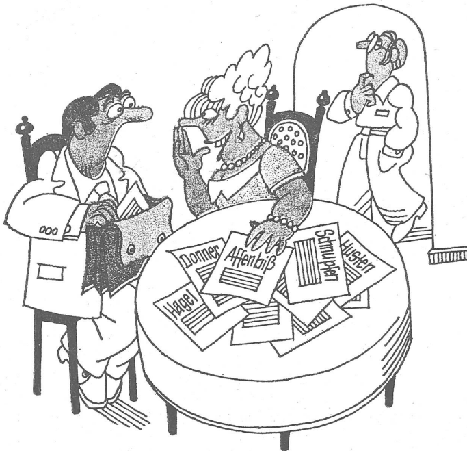
Die Frage an den Versicherungsexperten: «Mein Mann will morgen in seinem Kollektiv Massnahmen ergreifen. Schliessen Sie auch dafür Rückversicherungen ab?» (Die Werkätigen müssen zwar parieren, aber renitent sind sie doch.)

«Eulenspiegel», Ostberlin, Nr. 14 und 15 / 1981