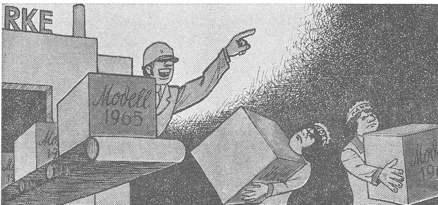
Wenn 1981 die Modelle von 1965 produziert werden: «Aber wie wir's produzieren, das ist ganz modern!»