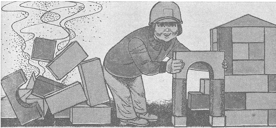
«Was kümmern mich meine Aufbauerfolge von gestern?»

«Eulenspiegel», Ostberlin, Nr. 14 und 15 / 1981