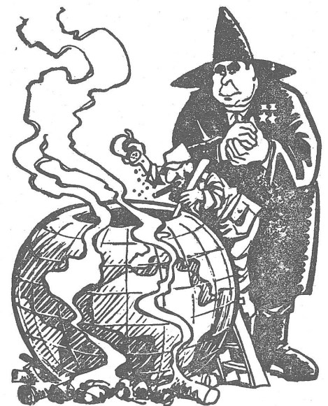
Der kleine Fidel rührt für den grossen Leonid die Suppe. Karikatur aus «Russkaja mysi», Paris, 23. 4. 1981.

Diese Entwicklungen haben Castros Beziehungen zu seinen Nachbarstaaten belastet. Um so dankbarer muss Kubas Staats- und Parteichef für die ungebrochene sowjetische Unterstützung sein. Sie äussert sich auch darin, dass Havanna zunehmend ein Konferenzort für die von der Sowjetunion kontrollierten Frontorganisationen wird. Vom 19. bis 21. April tagte das Präsidium des Weltfriedensrates in Havanna, und im Februar 1982 soll der Weltgewerkschaftsbund seinen 10. Kongress dort abhalten, erstmals übrigens ausserhalb Europas. P. S.