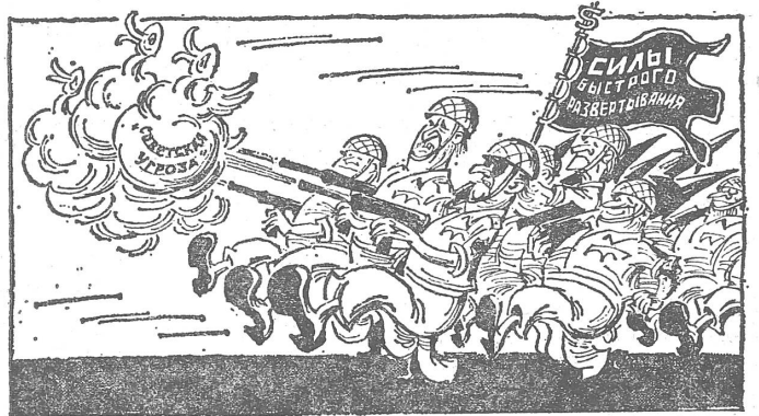
Wie die sowjetische Armeezeltung «Krasnaja Swjesda» (30. 1. 1981) Verleumdungen widerlegt. Auf Seite 2 zeigt sie in Fotografie eine Angriffsübung sowjetischer Truppen und auf Seite 3 eine Karikatur amerikanischer Truppen, die hinter dem «Rauchschleier» einer «mythischen» Drohung aus der Sowjetunion in Bewegung gesetzt werden.