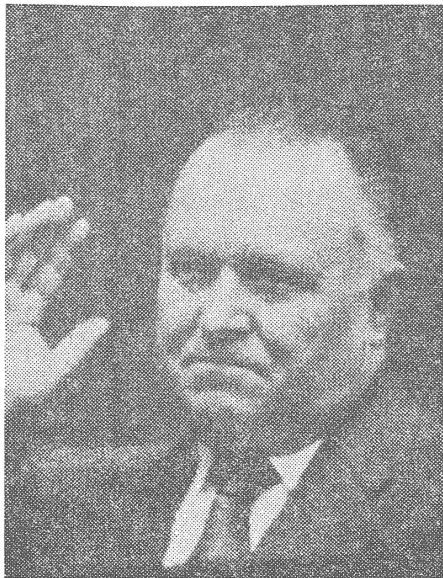
Parteichef Stanislaw Kania.