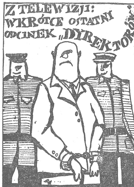
Im Fernsehen: Demnächst die letzte Folge unserer Serie «Die Direktoren». (4.1.1981)

Tja, die Nomenklaturleute entbehren die schützende Nestwärme von früher. Was sind sie heute? Zusätzliche Rebellen gegen das System oder im Gegenteil seine Infiltrate in die Gewerkschaftsbewegung? Auf jeden Fall sind sie wehleidiger, als früher ihre Untergebenen sein durften.