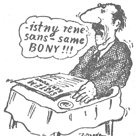
«Eine wahrhaftige Wiedergeburt: lauter Bons!» (18.1.1981) Statt des Essens kriegt der Gast im Restaurant bloss Bezugsgutscheine.

Während sich die NZS eindeutig dagegen aussprach («Gazeta robotnicza», Danzig, 20. 9. 1980), wollten wenigstens die SZSP-Kulturaktivisten die Möglichkeit dazu für den Fall offenlassen, dass zwischen Studenten und Hochschulbehörden in strittigen Fragen keine Einigung erzielt werden könnte («Prawo i Zycie», Warschau, 26. 10. 1980). Diese Stellungnahme einer SZSP-Unterabteilung war mehr als nur «Flucht nach vorne» angesichts eines grassierenden Mitgliederschwundes. An der