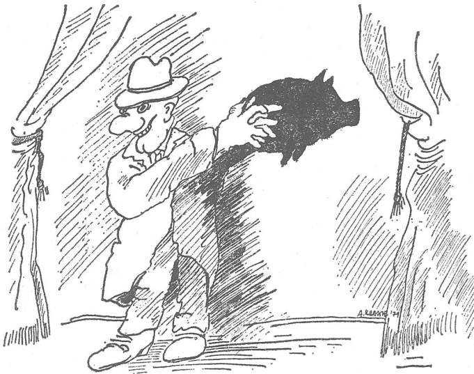
Die Illusionisten kommen den Bedürfnissen entgegen. (18.1.1981)

Frägt sich bloss noch, auf welcher Seite der geistigen Barrikade die Gaukler gesehen werden. Eher eine offene Interpretation als ein offenes Wort.