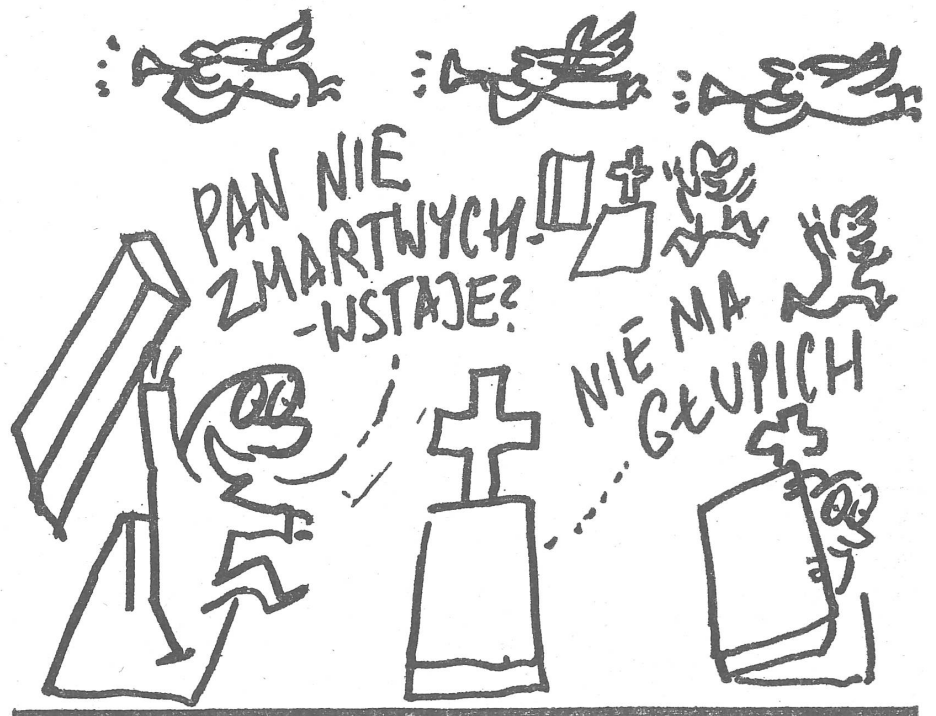
Aussichten: «Willst du nicht auferstehen?» – «Nein, so blöd bin ich denn doch nicht!» (... weil ihm im Grab nichts Schlimmeres passieren kann.) 14.12.1980

Ähnlich ultimativ verlangte man die Entfernung