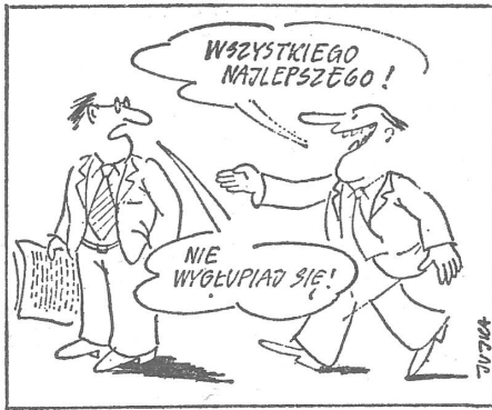
Quittierter Neujahrswunsch. «Alles Gute!» – «Mach keine Witze!» (4.1.1981)

gleichen Tagung forderten die «Kulturaktivisten» auch, dass es im Geschichtsunterricht keine «Tabu-Themen» mehr geben dürfe («Prawo i Zycie», 26. 10. 1980). Ähnliche Forderungen nach «unverfälschter Geschichte» werden von Elternseite auch an die Adresse der Mittelschulen gerichtet («Zycie Warszawy», 17. 12. 1980).