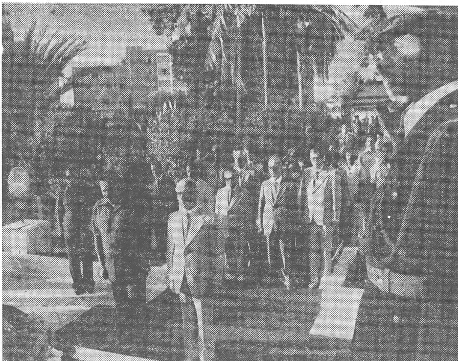
Partei-, Staats- und Regierungschef Ali Nasser Mohammed (vorne links) mit dem SED-Parteichef Erich Honecker (DDR) bei einer Kranzniederlegung.