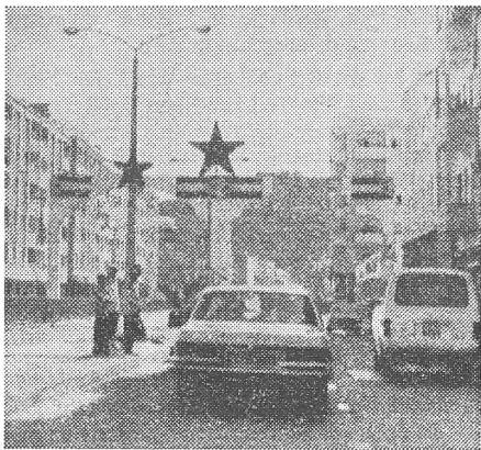
Nicht gerade Weihnachtssterne. Eine Hauptstrasse in Aden.

In der Zivilbevölkerung wächst die Unzufriedenheit mit der starken Sowjetpräsenz ebenfalls.