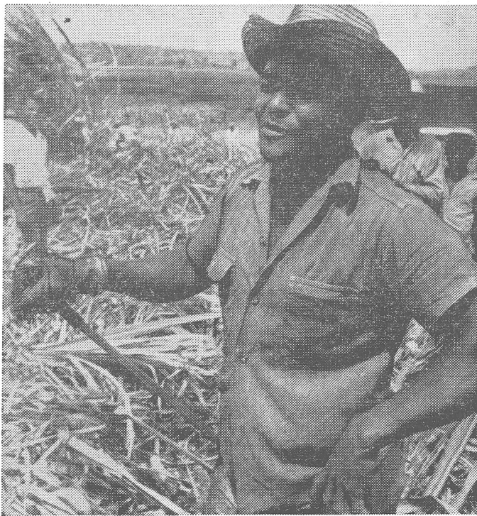
Gleich mehrere Beiträge geisseln die exportorientierten Monokulturen in Entwicklungsländern als Ausbeutungsmethode der westlichen Industrieländer. Nun ist das Hauptbeispiel für Monokultur die Zuckerproduktion auf Kuba. Das Ungleichgewicht ist seit dem Anbruch der sozialistischen Zeit kräftig akzentuiert worden. Der Zucker machte 1959 noch 77 Prozent vom kubanischen Export aus, 1974 aber 87 Prozent.

Aber die Sache der Monokultur wird von den Helvetas-Autoren nicht am Hauptbeispiel Kuba abgehandelt. Warum? Dreimal darf man raten.