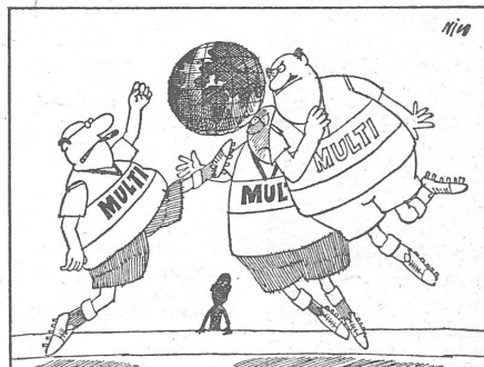
Dass die Multis schuld sind, weiss man bei der Jubiläumsschrift von vornherein: Das helle Feindbild auf Seite 1.

Der sozialen und politischen Partnerschaft verdankt die Schweiz noch etwas anderes: dass die Gefahr der Unterordnung unter den faschistischen bzw. marxistischen Totalitarismus gebannt wurde. Aenderungen der sozialen Strukturen erwiesen sich im innenpolitischen Interessenaus-