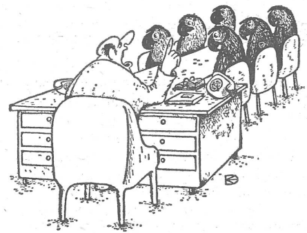
Kolchos-Präsident... (Alle Karikaturen «Krokodil», Moskau.)

Kosten tat diese Feier ein hübsches Sümmchen,