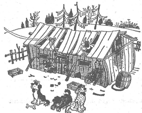
«Die Kühe niesen (= pfeifen) auf Zugluft und Feuchtigkeit...»

Die «Masken» sind Anweisungen von höherer Instanz: «An den Farmleiter: Bitte dem Ueberbringer 2 Schafe aushändigen — B. M.» «Wassja! Gib dem Genossen Sidorow 3 (drel) Hammel. (Unterschrift)» «An den Farmleiter: Ich erlaube das Abholen von...»