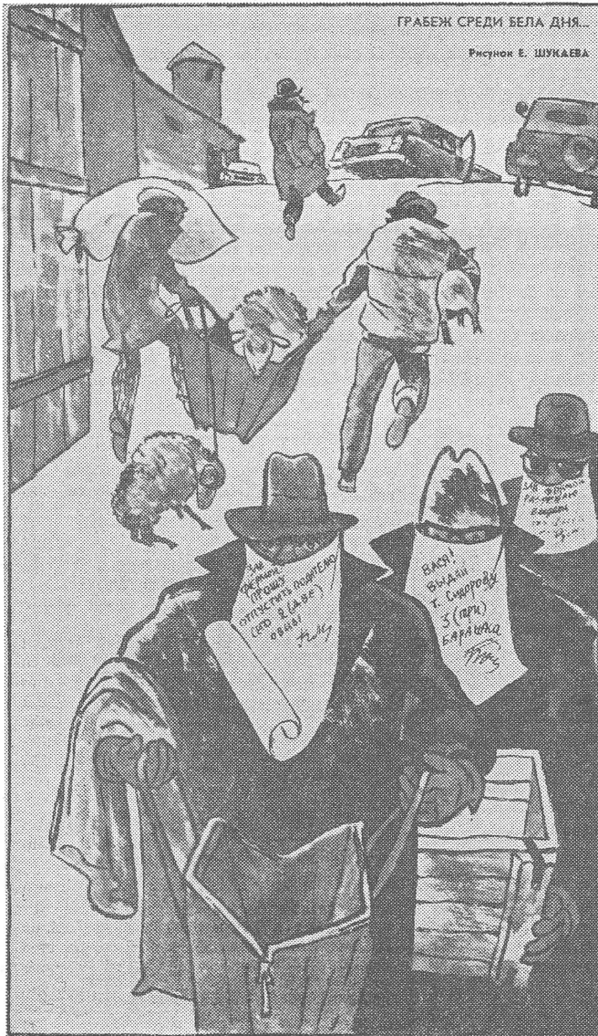
Ausraubung am helllichten Tag...

Hier ist auch das System nicht unschuldig. Die