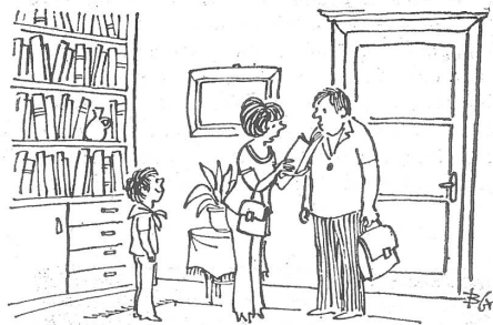
A propos Bildung.

Als überwiegend negativen Aspekt stuft der Bericht die Tatsache ein, dass die überwiegende Mehrheit der arbeitenden Bevölkerung einem Nebenverdienst nachgeht. Lebensnotwendigkeit oder Finanzierung luxuriöser Ansprüche? In den «meisten Fällen» das erste: unabdingbare Notwendigkeit zur Befriedigung der gesellschaftlichen Grundbedürfnisse. Am ausgeprägtesten ist das der Fall bei Jungverheirateten nach der Geburt ihres ersten Kindes. Die Wertung der Autoren: Das Einkommen aus dem Zweitjob trage materiell zur Bereicherung und Entwicklung der Lebenshaltung bei, aber der Einfluss auf die Lebensqualität sei fragwürdig. Der Zusatzverdienst gehe vielleicht auf Kosten von Hobbies, kulturellen Aktivitäten, Familienleben und Weiterbildung oder auch ganz einfach auf Kosten der Gesundheit.