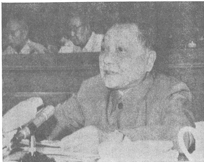
Rechts: Deng Xiaoping bei seiner Rede vom 15. 6. 79: Schluss mit dem Klassenkampf.