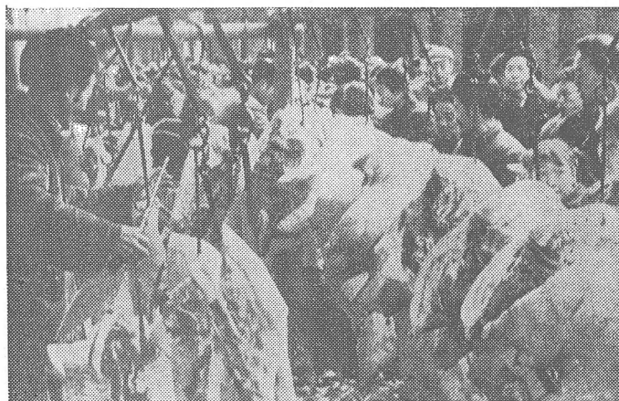
Oben: Schweinefleisch auf einem Landmarkt. Hier können die Bauern die Produkte ihrer privaten Kleinviehhaltung zum eigenen Profit verkaufen.

«In den vergangenen dreissig Jahren hat sich die Klassenstruktur unserer Gesellschaft grundlegend gewandelt. (...) Unsere Intellektuellen, einschliesslich der überwiegenden Mehrheit der alten Intelli-